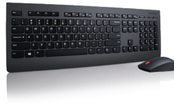
Combinación de teclado y ratón inalámbricos profesionales de Lenovo REF.: 4X30H56796