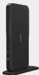
Acer USB Type-C Dock III