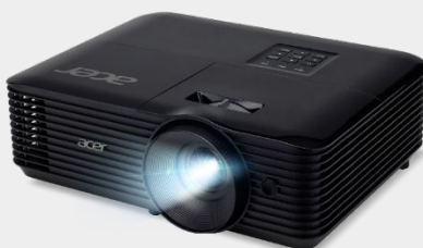
Projecteur 4,500 Lumens SVGA X1128HK