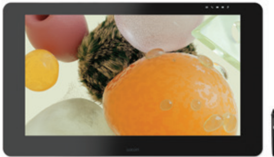
Künstler: David McLeod

Wacom Cintiq Pro 32 und 24 sind hochentwickelte Kreativ-Stift-Displays. In Verbindung mit dem Wacom Pro Pen 2 machen sie jeden kreativen Durchbruch noch besser.