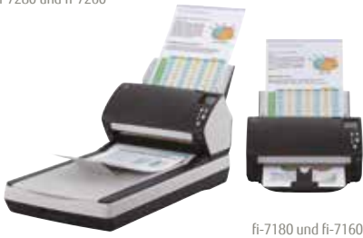
fi-7180 und fi-7160

fi-7160/fi-7260 – A4-Hochformat mit 300 dpi: 60 Seiten/min bzw. 120 Bilder/min Scannen von gemischten Stapeln bis zu 80 Blatt