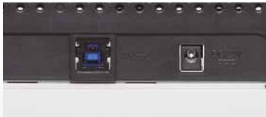
Hohe Geschwindigkeit über USB 3.0 Schnittstelle