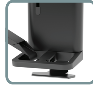
LOW PROFILE 98-490-224 (MATZWART)