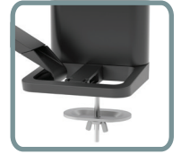
DOORVOER 98-492-009 (MATZWART)