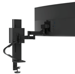
Enkel met standaardklem