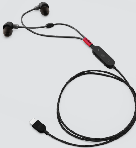
LENOVO GO USB-C ANC IN-EAR-KOPFHÖRER ARTIKELNR.: 4XD1C99220

Diese schlanke, elegante Maus in Standardgröße bietet herausragende Qualität für eine moderne kabellose Reiselösung. Die kompakte Maus für Rechts- und Linkshänder zeichnet sich durch exzellente Mobilität und perfekte Ergonomie aus. Der optische 1.200-dpi-Sensor ermöglicht leichtgängiges, präzises Arbeiten. Für die Verbindung zu allen kompatiblen Lenovo Geräten ist nur ein Nano-Empfänger erforderlich.