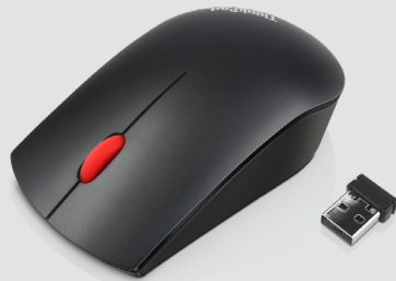
THINKPAD ESSENTIAL FUNKMAUS ARTIKELNR.: 4X30M56887

Diese schlanke, elegante Maus in Standardgröße bietet herausragende Qualität für eine moderne kabellose Reiselösung. Die kompakte Maus für Rechts- und Linkshänder zeichnet sich durch exzellente Mobilität und perfekte Ergonomie aus. Der optische 1.200-dpi-Sensor ermöglicht leichtgängiges, präzises Arbeiten. Für die Verbindung zu allen kompatiblen Lenovo Geräten ist nur ein Nano-Empfänger erforderlich.