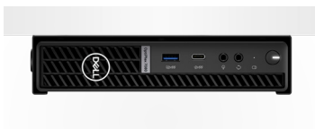
VESA-HALTERUNG MIT ADAPTERKLAMMER FÜR OPTIPLEX MICRO

Montieren Sie Ihr System an einer Wand oder unter einer Oberfläche mit einem VESA-kompatiblen DVD +/-RW-Gehäuse mit vollständigem Zugriff auf das optische Laufwerk. Umfasst eine Adapterbox für die sichere Unterbringung des Netzadapters des Systems.