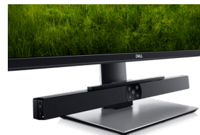
DELL PROFESSIONAL SOUNDLEISTE – AE515M

Optimieren Sie Ihren Arbeitsplatz mit diesem effizienten 21,5"-Monitor mit extrem schmalen Rahmen, wenig Platzbedarf und Komfort-Features.