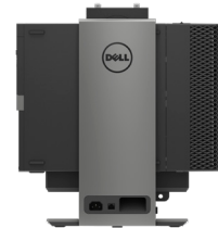
ALL-IN-ONE-STANDRAHMEN FÜR OPTIPLEX SMALL FORM FACTOR (IN KÜRZE VERFÜGBAR)

Die Montagelösung mit kleiner Stellfläche passt sich an Ihre Umgebung an und bietet Kabelmanagement, eine verstellbare Monitorhöhe sowie Funktionen zum Neigen, Schwenken und Drehen.