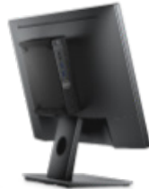
OPTIPLEX MICRO-ALL-IN-ONE-STANDRAHMEN FÜR MONITORE DER DELL E SERIE

Sorgen Sie für mehr Platz auf dem Schreibtisch mit diesem eleganten Arm zum Befestigen von System und Monitor.