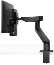
DELL EINZELMONITORARM – MSA20

Sorgen Sie für mehr Platz auf dem Schreibtisch mit diesem eleganten Arm zum Befestigen von System und Monitor.