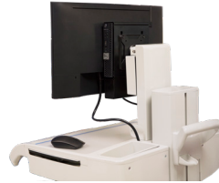
VESA-HALTERUNG MIT ADAPTERKLAMMER FÜR OPTIPLEX MICRO

Mit dieser Halterung kann der Micro mithilfe von VESA an ausgewählten Displays der Dell E Serie angebracht werden.