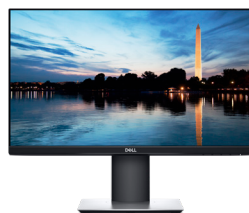
DELL 22"-MONITOR – P2219H

23,8"-Display mit ultradünner Blende, optimiert für mehr Produktivität mit 2 Monitoren. Die Funktion zum einfachen Anordnen ermöglicht Multitaskingeffizienz und die kleine Basis spart wertvolle Arbeitsfläche ein.