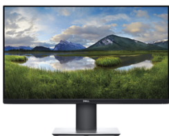
DELL 24 MONITOR – P2419H

23,8"-Display mit ultradünner Blende, optimiert für mehr Produktivität mit 2 Monitoren. Die Funktion zum einfachen Anordnen ermöglicht Multitaskingeffizienz und die kleine Basis spart wertvolle Arbeitsfläche ein.