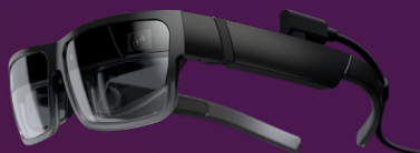
ThinkReality A3 XR1 3G+32G

Eine vollständige Liste mit den Optionen und Zubehör finden Sie unter: