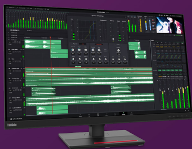
ThinkVision P32p Display