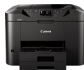
MAXIFY MB2750 Modelle