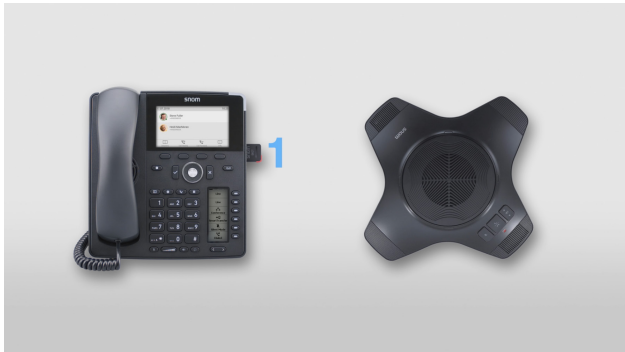
Dongle in das Gerät einstecken