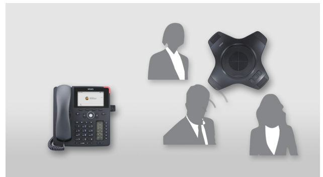
Jetzt können Sie den angeschlossenen kabellosen Lautsprecher in bis zu 25 m Entfernung verwenden.