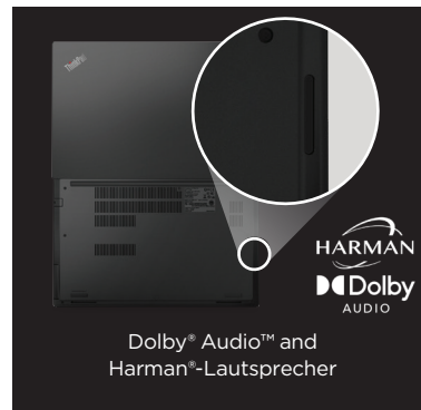
Dolby® Audio™ und Harman®-Lautsprecher