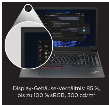
Display-Gehäuse-Verhältnis: 85 %, bis zu 100 % sRGB, 300 cd/m 2