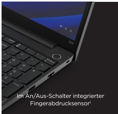
Im An/Aus-Schalter integrierter Fingerabdrucksensor 1

Daten bleiben dank fortschrittlicher Sicherheitsfunktionen wie der FHD-Hybrid-IR-Kamera , Windows Hello -Gesichtsauthentifizierung, einer Webcam-Abdeckung und diskretem TPM-Chip geschützt.