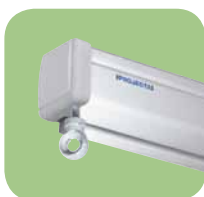
Handbediente Projektionswand in hohe Qualität