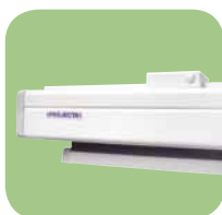
Easy Install mit Kunststoffhalterungen