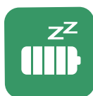
Lungo Tempo in standby