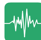
Cancellazione del rumore

Yealink W73H è la nuova generazione di ricevitori wireless, moderni ed eleganti, studiata per l'uso aziendale. Il nuovo design ID, più elegante e pratico da trasportare, offre una batteria di lunga durata superiore e una qualità della comunicazione superiore.