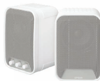
Hohe Klangqualität durch zwei 15-W-Aktivlautsprecher