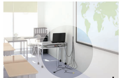
Ohne Steuereinheit mit Anschlussfeld Epson ELPCB01