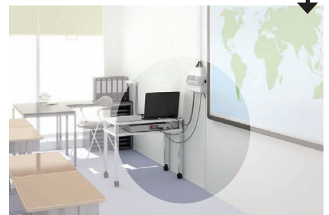
Mit Steuereinheit mit Anschlussfeld Epson ELPCB01