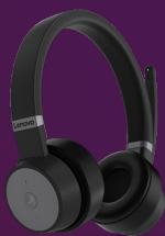
Cuffie ANC wireless Lenovo Go