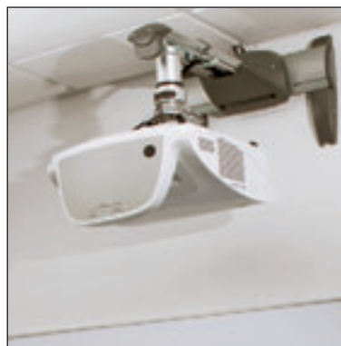
Für interaktive und Short Throw-Projectors