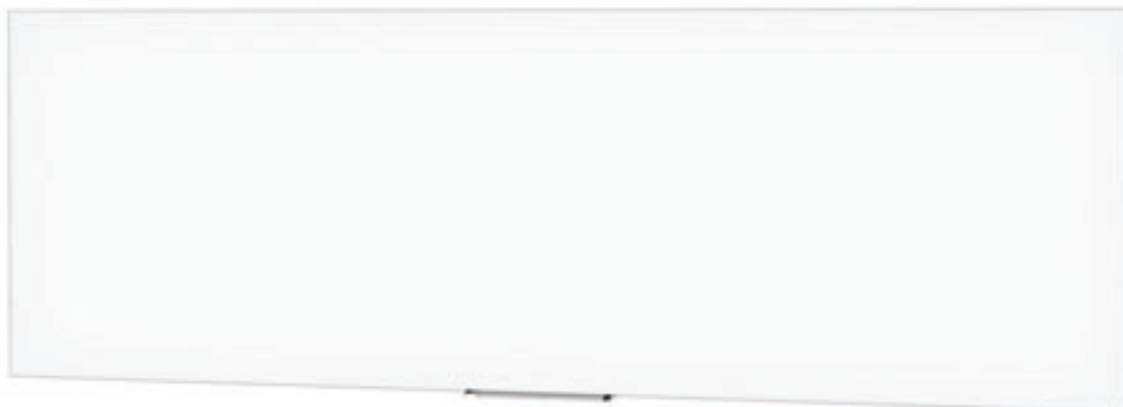
Panoramic: Breite von 366 bis 488 cm