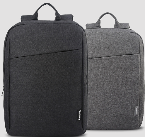
Zaino B210 per notebook Lenovo da 39,62 cm (15,6") N/P: 4X40T84059 (BLACK), 4X40T84058 (GREY)

Zaino dal design casual ed elegante, realizzato in un tessuto di alta qualità, resistente e idrorepellente. Grazie alla capienza elevata, è perfetto per notebook da 38,1 cm (15") e dispone di varie tasche e numerosi scomparti in pratiche posizioni.