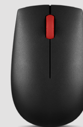
Mouse wireless compatto Lenovo Essential N/P: 4Y50R20864

Comode, resistenti e convenienti, queste cuffie sono ideali per l'uso quotidiano. I confortevoli padiglioni auricolari e l'archetto regolabile le rendono semplici da indossare giorno dopo giorno. Ottimizzato per VoIP, il microfono con rotazione a 180° e braccetto garantisce un audio sempre chiaro.