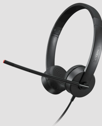
Cuffia stereo analogica Lenovo Essential N/P: 4XD0K25030

Zaino dal design casual ed elegante, realizzato in un tessuto di alta qualità, resistente e idrorepellente. Grazie alla capienza elevata, è perfetto per notebook da 38,1 cm (15") e dispone di varie tasche e numerosi scomparti in pratiche posizioni.