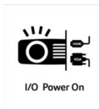
I/O Power On

Mit der HDMI Power On Funktion ist der Projektor in der Lage sich automatisch einzuschalten, sobald der Projektor ein Signal per HDMI oder VGA zugespielt bekommt. Sie brauchen den Projektor nicht mehr separat zu starten, sondern können einfach ihr Notebook, ihren Receiver oder die Spielekonsole einschalten und der Projektor schaltet sich automatisch ebenfalls ein.