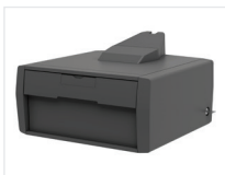
TALL-EINZELSCHUBLADE DUNKELGRAU 97-989-622