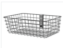
GROSSER DRAHTKORB DUNKELGRAU 98-135-282