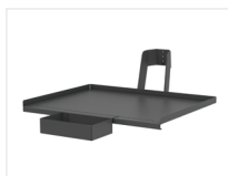
VORDERE ABLAGE DUNKELGRAU 98-417-289