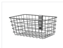
KLEINER DRAHTKORB DUNKELGRAU 98-6136-282