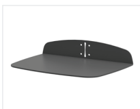
ABLAGEFLÄCHE DUNKELGRAU 97-507-282