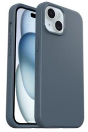
Bluetiful 77-92933 (Retail) 840304733125