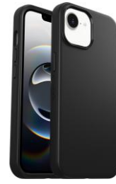
Black 77-92928 (Retail) 840304733071 77-94126 (ProPack) 840304745371