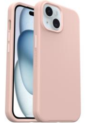
Ballet Shoes 77-92945 (Retail) 840304733248