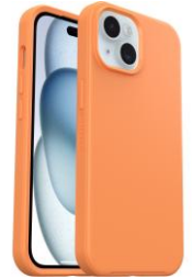
Sunstone 77-92940 (Retail) 840304733194