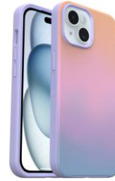
Soft Sunset 77-93399 (Retail) 840304737628