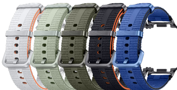
Athleisure Band (S/M) / (M/L) ET-SOL32 / ET-SOL 33