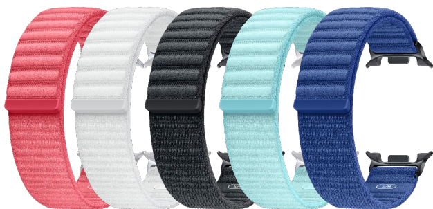
Fabric Band (S/M) / (M/L) ET-SVL32 / ET-SVL 33