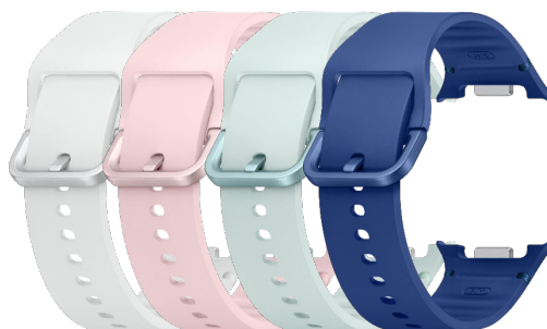
Sport Band (S/M) / (M/L) ET-SNL32 / ET-SNL 33