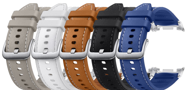
Hybrid Band (S/M/L) ET-SLL50