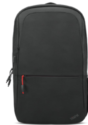
Sac à dos Lenovo Business Casual de 43,18 cm (17")