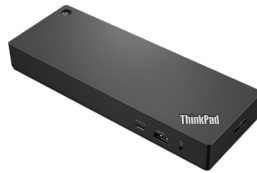
Station d'accueil ThinkPad Universal Thunderbolt™ 4