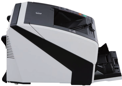
fi-7800 – A4 Querformat mit 300 dpi 110 ppm / 220 ipm fi-7900 – A4 Querformat mit 300 dpi 140 ppm / 280 ipm Scannen von gemischten Stapeln über die Zufuhr mit 500 Blatt Fassungsvermögen