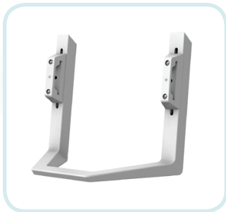
EMPFOHLENES ZUBEHÖR: LX DUAL DIRECT HANDLE KIT 98-037-062

JEDER BILDSCHIRM HAT INDIVIDUELLE HÖHEN- UND NEIGUNGSEINSTELLUNG