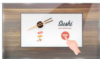
Touch durch Glas

Der Open-FraProLite TF1015MC verwendet die PCAP-Touch-Technologie und ist verbaut in einem formschönen Edge-to-Edge Glas Design. Dank seiner Glasauflage und dem robusten Rahmen garantiert der Bildschirm eine hohe Haltbarkeit und Kratzfestigkeit und ist somit ideal für Kiosksysteme und Anwendungen im öffentlichen Einsatz geeignet. Die IPS-Panel-Technologie bietet eine präzise und konsistente Farbwiedergabe mit weiten Betrachtungswinkeln. Ausgestattet mit einer Schaumstoffdichtung bietet das Gerät eine nahtlose Integration in Kiosksysteme. Mit der IP65 Zertifizierung bietet das Gerät eine Staub- und Wasserresistenz in der Bedienung. Die Ausrichtungsoptionen Quer- und Hochformat sorgen für flexible Montagemöglichkeiten. Der TF1015MC kann mit separat erhältlichen Befestigungswinkeln ausgestattet werden ( OMK2-1 ), die den Einbau erleichtern. Die ideale Lösung für Kiosksysteme, industrielle Umgebungen, Kontrollräume und interaktive Multimedia-Anwendungen.