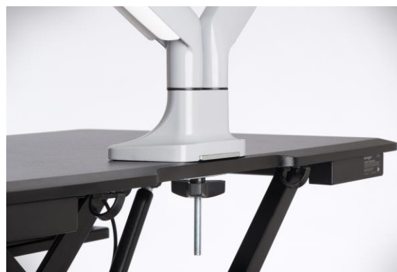
Installation mit Gewindeschraube (Tülle)