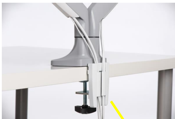
Installation mit C-Klemme