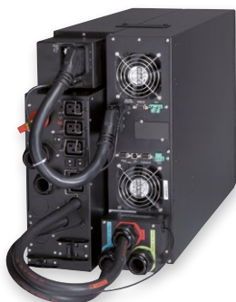
Eaton 9PX 11kVA mit Wartungsbypass

Die 9PX ist eine Energy Star® qualifizierte USV