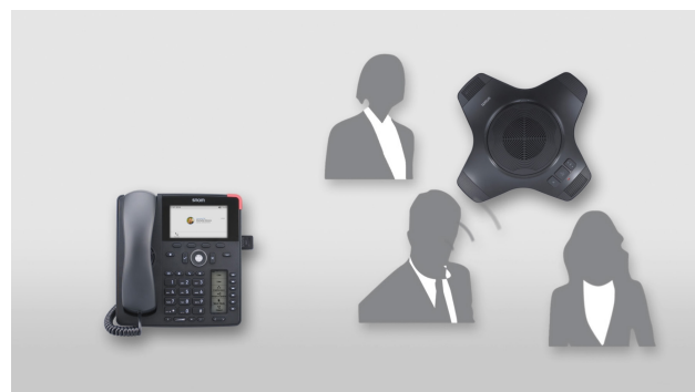
Maintenant vous pouvez utiliser l'extension conférence jusqu'à 25 mètre de distance