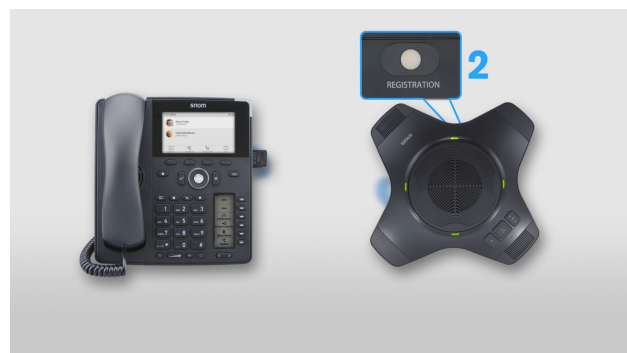
Etablir une connexion DECT entre le téléphone et l'extension conférence