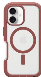
Dust Bowl 77-96060 (Retail) 840304768882