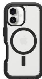
Dark Side 77-96056 (Retail) 840304768844 77-96059 (ProPack) 840304768875