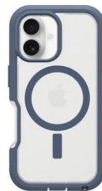
Mountain Storm 77-96064 (Retail) 840304768929