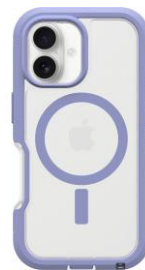
Lavender Haze 77-96062 (Retail) 840304768905