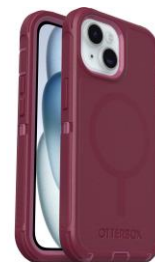
Foxberry 77-97535 (Retail) 840304783748