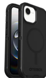
Black 77-97534 (Retail) 840304783724 77-97673 (ProPack) 840304790500