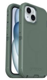
Forest Ranger 77-97536 (Retail) 840304783762