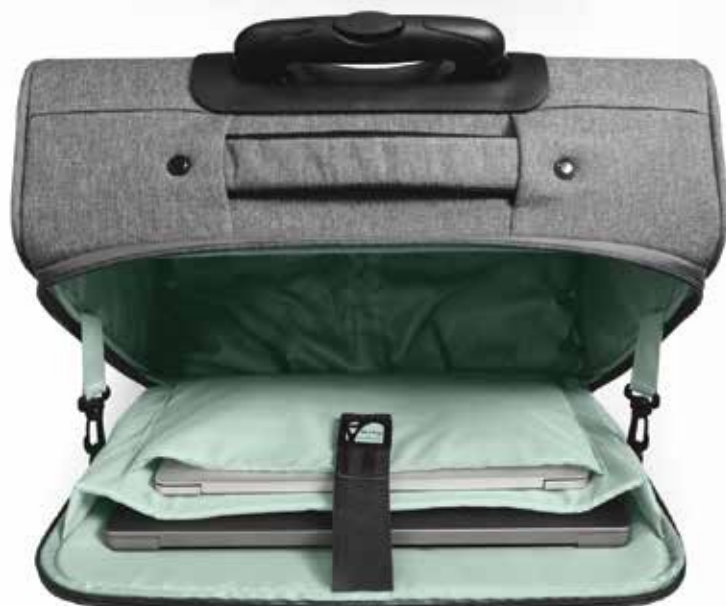
Padded notebook compartment 15.6/16" Compartment rembourré pour ordinateur portable 15,6/16"