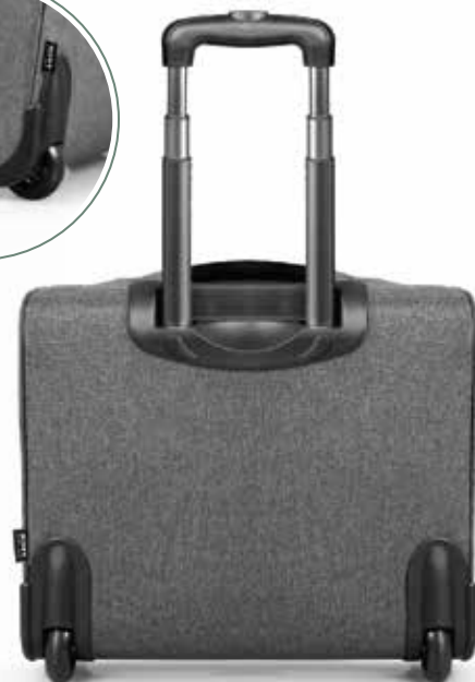
Plastic feet and rubber wheels Pieds en plastique et roues en gomme