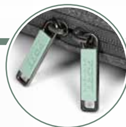
Ultra-resistant and elegant Metal puller Tirette métallique ultra résistante et élégante