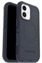
Riverside 77-98358 (Retail) 840434710805