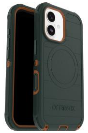
Coopersmith 77-98362 (Retail) 840434710881