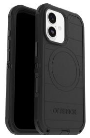
Black 77-98354 (Retail) 840434710720 77-98356 (ProPack) 840434710768