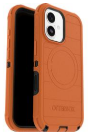
Hi Vis 77-98367 (ProPack) 840434710980