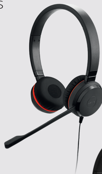
EVOLVE 20 SE