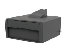
CAJÓN ALTO GRIS OSCURO 97-989-622