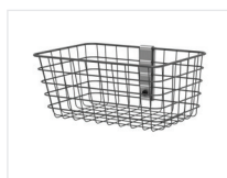
CESTA METÁLICA PEQUEÑA GRIS OSCURO 98-136-282