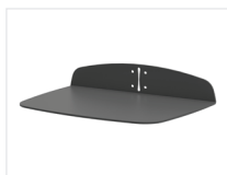
BANDEJA GRIS OSCURO 97-507-282