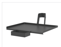
BANDEJA DELANTERA GRIS OSCURO 98-417-282