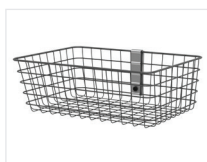
CESTA METÁLICA GRANDE GRIS OSCURO 98-135-282