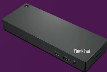
ThinkPad Thunderbolt™ 4-Dock Artikelnr.: 40B00300xx