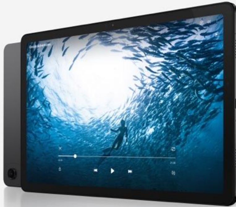
Abbildung senkrecht. Foto- und Modellvorfügbarkeit können je nach Land oder Anbieter variieren.