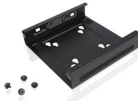
Soporte VESA II para ThinkCentre Tiny REF.: 4XFON03161