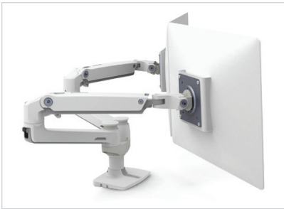
LX-MONTAGEARM FÜR 2 MONITORE NEBENEINANDER (Weiß)

DIE KABEL VERLAUFEN UNTER DEM ARM UND SIND DADURCH NICHT IM WEG